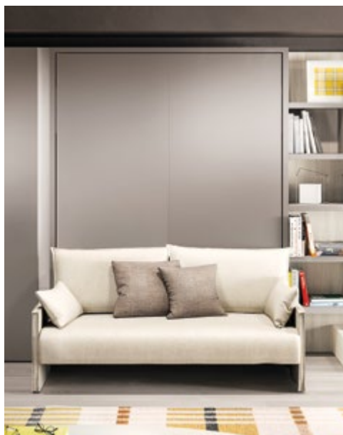
PENELOPE 2 SOFA - P.35