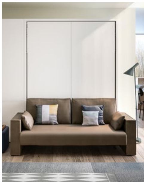
PENELOPE 2 SOFA - P.62,3