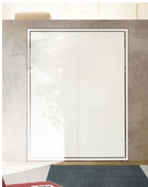
PENELOPE 2 STANDARD - P.62,3