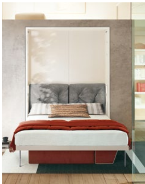
PENELOPE 2 STANDARD - P.35