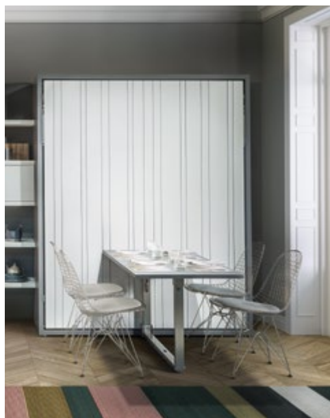
PENELOPE 2 DINING - P.62,3