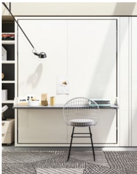
PENELOPE 2 BOARD - P.62,3